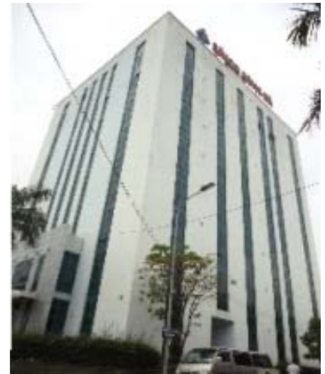
「EGUCHI VIETNAM」事務所があるシムコ本社ビル