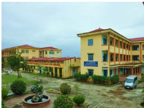
ハノイ郊外にあるシムコの学校