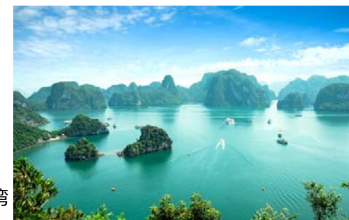
世界遺産のハロン湾